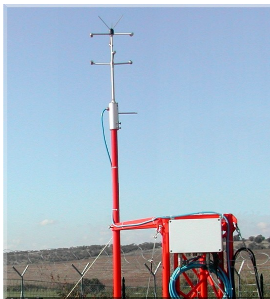
SimodRT con anemometro ultrasonico uSonic-3

Nel caso, il trasferimento dei dati può avvenire tramite una qualunque delle modalità previste, ovvero LAN, MODBUS/TCP, uscita seriale diretta. A richiesta è possibile integrare nel sistema altre vie di comunicazione e comando.