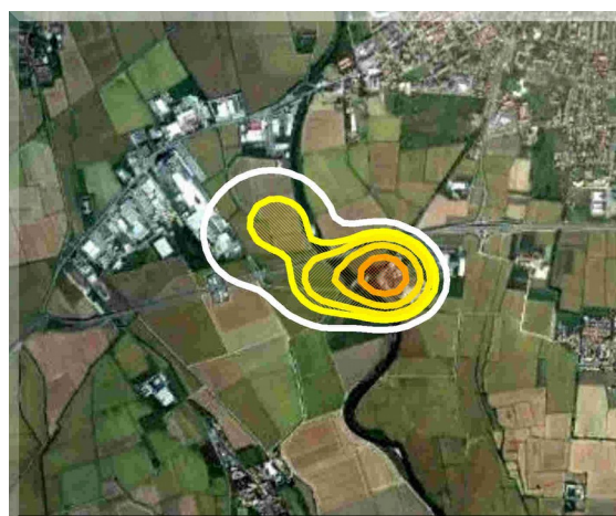
Mappa tipo ricadute o di unità di odore al suolo